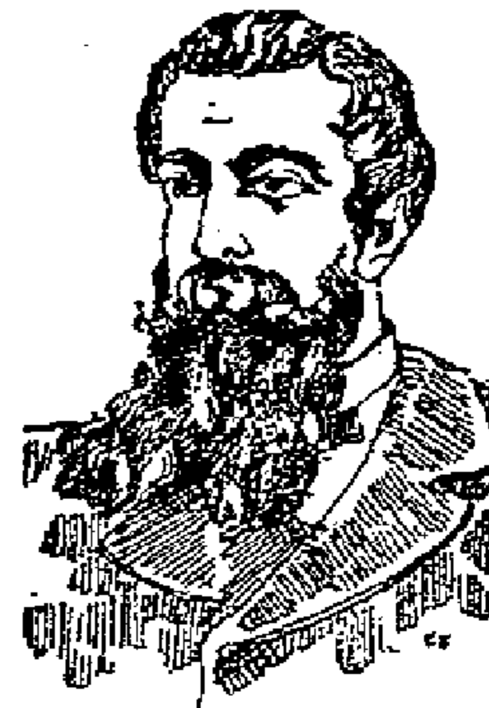
DOPO LA CURA